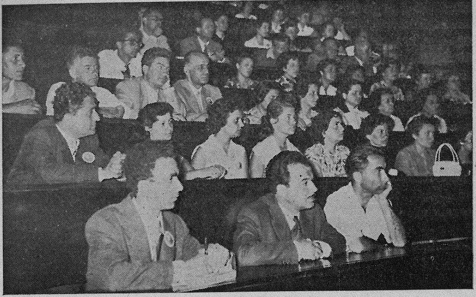
Dinleyicilerden bir grup