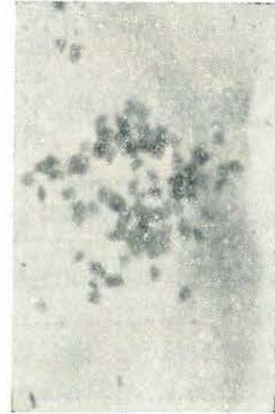
Şekil: 2 — Digitalis lutea ( 2n = 56 )