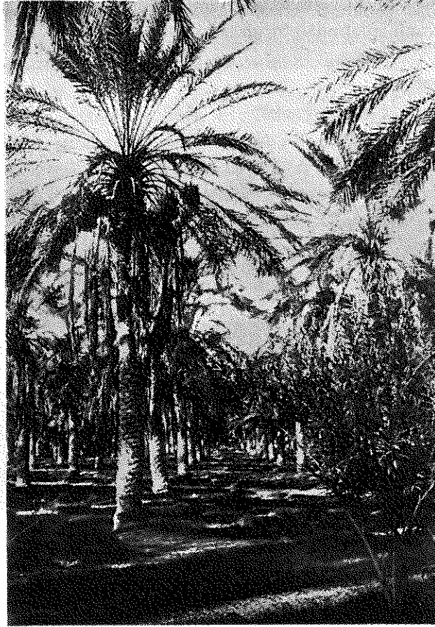
Şekil 3 : El Arfian Ziraî Deneme İstasyonu: Hurmalık.

Biskra'nın güneyi artık tamamen step veya yarı çöl halinde idi. Kumlu ve tuzlu bu topraklar üzerinde halofit (tuzcul bitki) ler bakımından fevkalâde zengin bir vejetasyon göze çarpıyordu. Chenopodiaceae familyasından Salicornia arabica , Salsola tetrandra , Salsola ver-