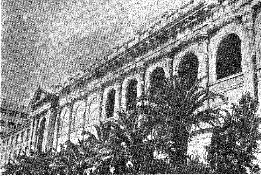
Şekil 6 : Cezayir Üniversitesinin 7 Haziran 1962 tarihli yangında harap olan kütüphanesi.

Tugurt şehrinde artık Büyük Sahranın kenarına ulaşmış bulunuyorduk. Nitekim şehrin doğusuna yaptığımız gezide, kendimizi tamar-