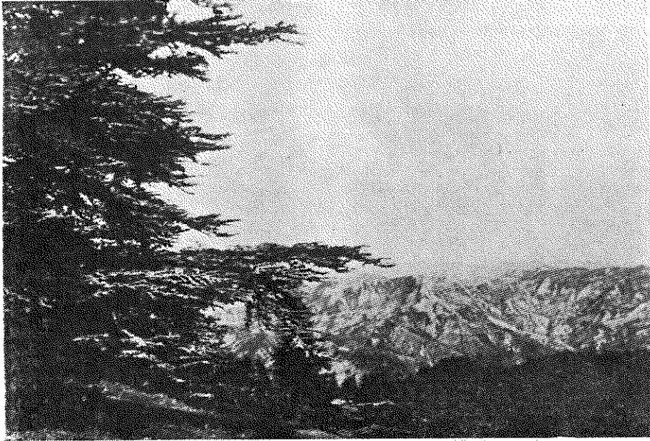
Şekil 2 : Setif-Batna: Atlas sediri ( Cedrus atlantica ) ormanları ve Atlas dağları.

Quercus ilex ile birlikte Atlas dağlarının en tipik ağaçlarından biri olan Cedrus atlantica (Atlas sediri) de kendini gösterdi. 1700 m.ye ulaştığımız zaman muazzam bir sedir ormanı içinde bulunuyorduk ve Atlas dağları önümüze şahane bir manzara sermişti (Şekil: 2). Yer yer yeşil ile kurşuni-yeşil arasında değişen renklerde bir tabiat zenginliği içindeydik. Atlas sedirini yerinde görebilmiş olmak, muhakkak ki gezimizin en heyecanlı anlarından birini teşkil etti.