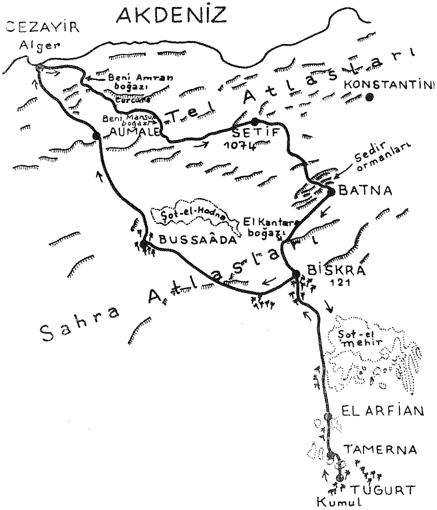
Şekil 1 : Cezayirde yapılan gezi esnasında takip edilen yol.