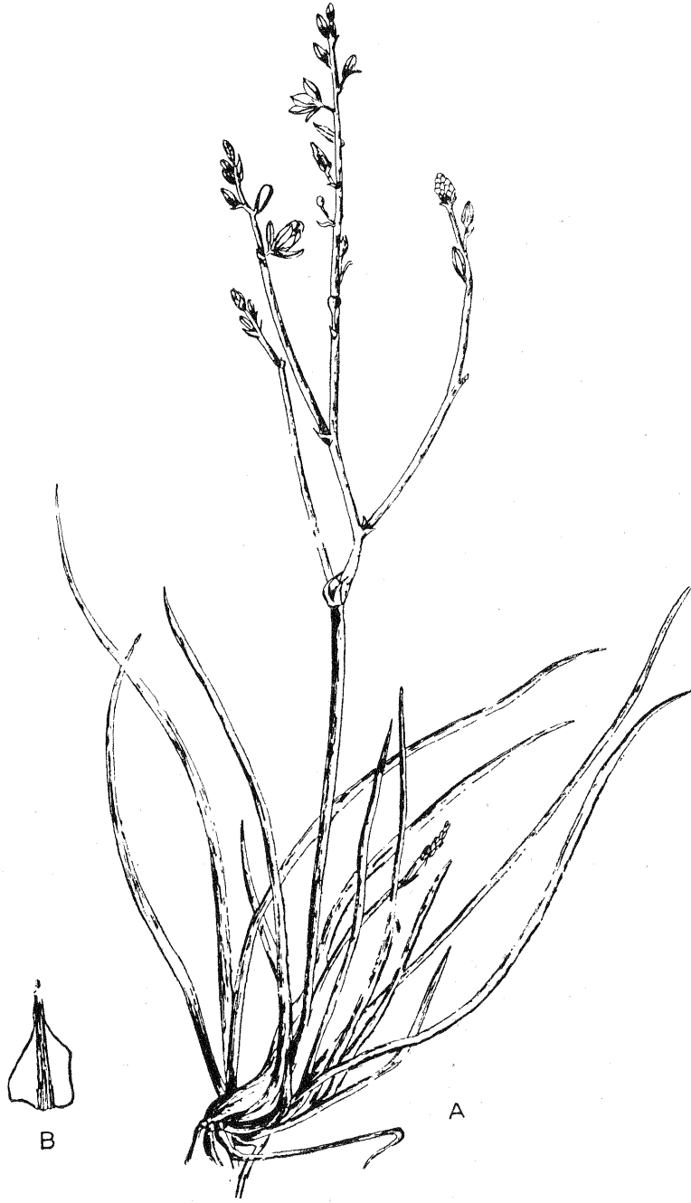
Şekil 1 : Asphodelus fistulosus L. : A. Çiçekli bitki, B. Zarımsı ve geniş yaprak tabanı (Orijinal).