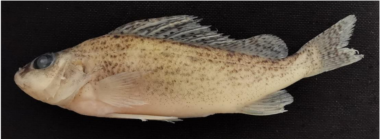
Şekil 1. Gymnocephalus cernua (126,4 mm Stadart Boy, Pamuklu Gölü)

Meriç-Ergene Havzasında 13 farklı gölde arazi çalışması gerçekleştirilmiştir. Arazi çalışması sonucunda bunlardan Gala Gölü'nde 107, Sığırcı Gölü'nde 92 ve Pamuklu Gölü'nde ise 18 adet olmak üzere toplam 217 adet G. cernua türüne ait bireye rastlanmıştır (Şekil 1). Her gölden rastgele seçilen 10'ar bireye ait meristik özellikler sayılmış olup bireylerin Kottelat & Freyhof (2007) tarafından G. cernua türü için verilen tanımlayıcı özellikler ile uyduğu belirlenmiştir (Tablo 1, Şekil 1).