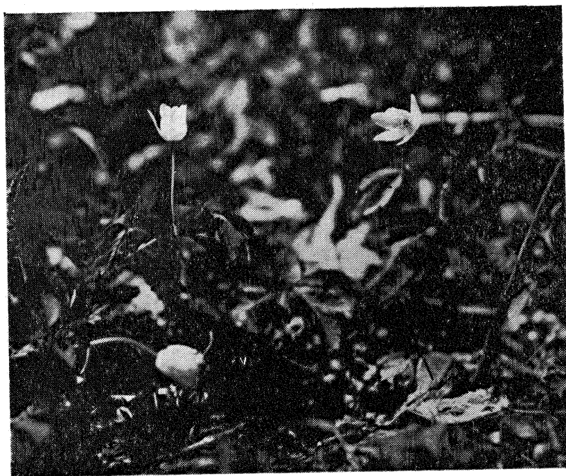
Şekil 3 : Anemone nemorosa . İstanbul: Üsküdar - Şile yolu, Ömerli - Heciz arası, Üvezli'den 9 km. önce. 6.4.1963. H.DEMİRİZ 4978 (ISTF).