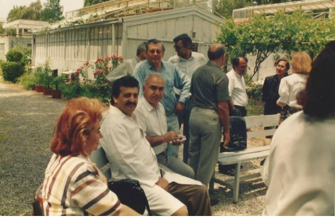
Foto 12. Ege Üniversitesi Botanik Bahçesinden, bir "eski mezunlar" toplantısı.