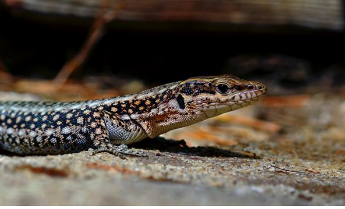
Foto 18. Anadololacerta budaki (Eiselt et Schmidtler, 1986).