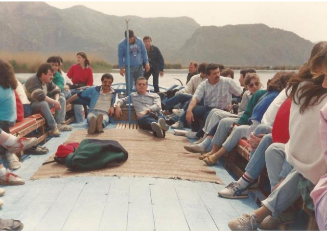
Foto 13. 1980'li yılların sonları, öğrenciler Köyceğiz Kanalı'ndan İztuzu plajına götürülüyorlar.