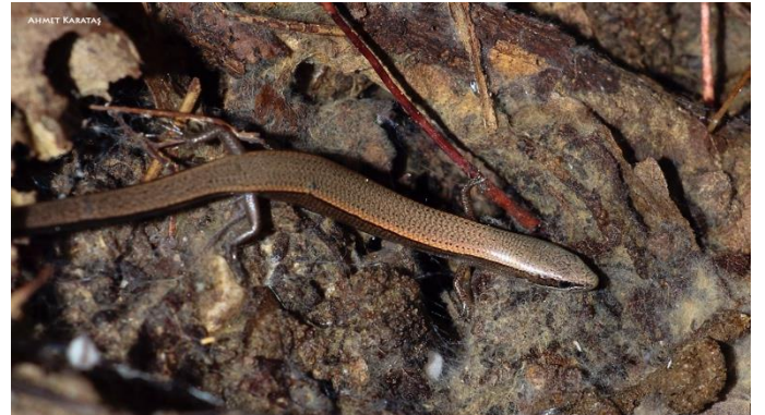
Foto 17. Ablepharus budaki Göçmen, Kumlutaş et Tosunoğlu, 1996 (A. Karataş arşivi).

AKendi adı verilen dört takson ise yine kertenkelelerden; Lacerta oertzeni budaki Eiselt et Schmidtler, 1986 (1987) (güncel geçerli adı: Anatololacerta budaki ) ve Ablepharus kitaibelii budaki Göçmen, Kumlutaş et Tosunoğlu, 1996 (güncel geçerli adı: Ablepharus budaki ) ve Ophisops elegans budakibarani Tok, Afşar, Yakın, Ayaz et Çiçek, 2017 ile yarasalardan Myotis capaccinii abidinbudakii Karataş, 2019’dur (Foto 17-19).