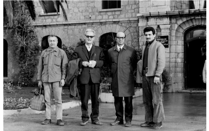
Foto 10. Mehmet K. Atatürk'ün kaleminden: "74 kışında Nil kaplumbağalarının (Trionyx triunguis) Dalaman civarındaki olası habitatlarını tespit etmek için bölgede bir araştırma gezisi yapmıştık. Gezi süresince Dalaman Devlet Üretme Çiftliği'nde misafir edildik. Gezinin ilk günü çok kibar bir kişi olan çiftlik müdürü sayın bay Baybaş'ı (adını hatırlayamıyorum) "istasyondan bozma müdüriyet binasında" ziyaret etmiştik. Veli efendi, Muhtar Hoca, sayın bay Baybaş ve Abidin Hoca ile".