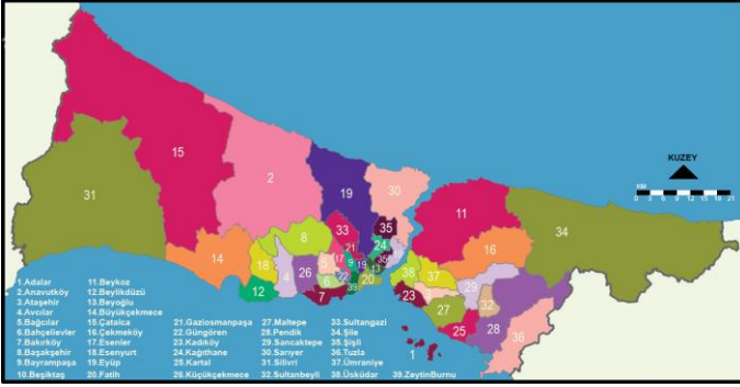
Şekil 1. İstanbul ili haritası